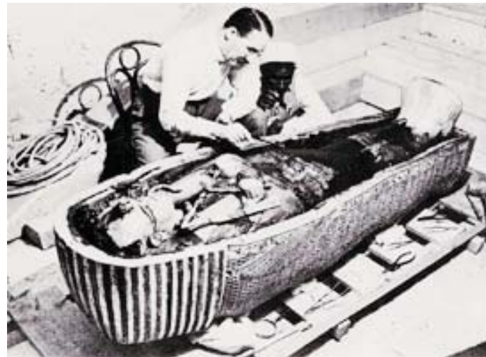
El Cairo, 1922 Lord Carnavon ante el sarcófago profanado de Tutankamón.